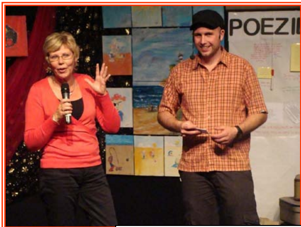
De finale op weg naar het grote gala in Carré